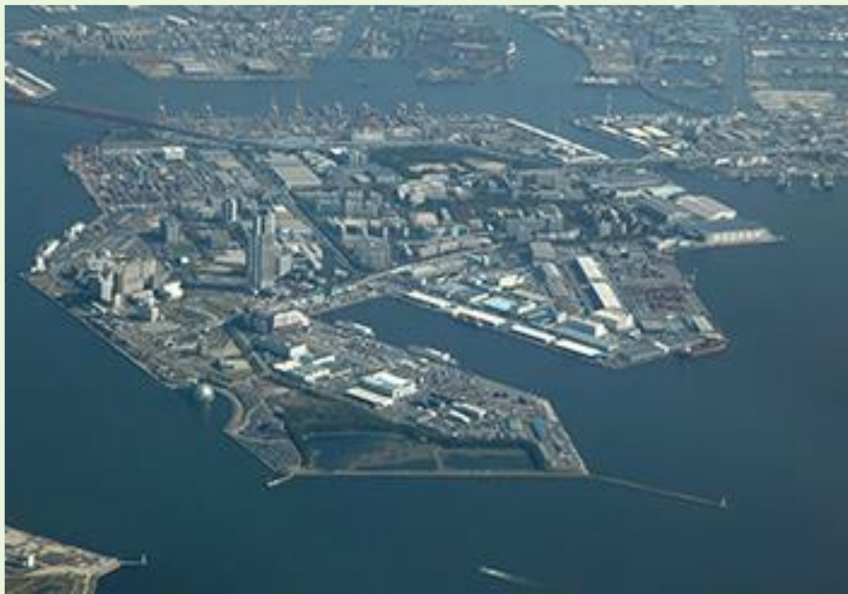
大阪港港湾地域航空写真: 咲州全景

日 時 平成30年10月19日(金) 13:00～(受付開始12:00～) 会 場 大阪国際会議場(グランキューブ大阪)5階メインホール 大阪市北区中之島5丁目3番51号 TEL:06-4803-5555